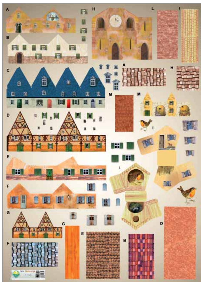
HDCADE185 - The Village