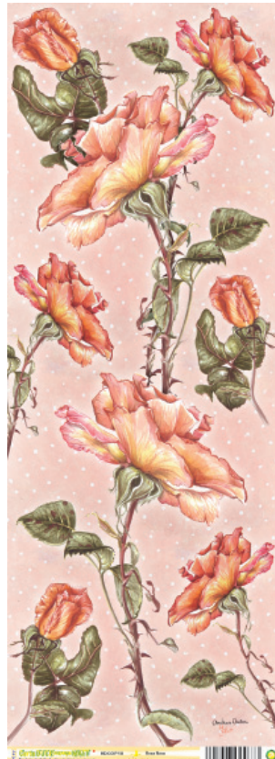
HDCOP10 Rose Rosa